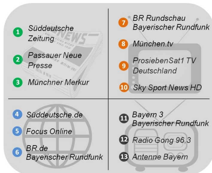
Abbildung 4: Quellenauswahl – 13 leitende Nachrichtenjournalisten

Diese Studie trifft Aussagen über die Handlungslogik der Massenmedien in Deutschland. Es wurde durch die Auswahl heterogener Akteure versucht, ein möglichst differenziertes Abbild des deutschen Medienmarktes zu schaffen. Aufgrund des zeitlichen und finanziellen Rahmens der Studie, die als Masterarbeit am Institut für Kommunikationswissenschaft und Medienforschung der LMU München entstand, stammen alle 13 Gesprächspartner aus dem Großraum München. Die Vielfalt an medialen Akteuren in diesem Raum erlaubte es dennoch, Interviewpartner zu rekrutieren, die sich anhand von vier Merkmalen unterscheiden: „Medialer Kanal“ (TV, Radio, Print, Online), „Rechtlicher Rahmen“ (öffentlich-rechtlich vs. privat-kommerziell), „Reichweite/Relevanz“ (national vs. regional vs. lokal) und „Position im publizistischen Wettbewerb“ (viele vs. weniger Wettbewerber).