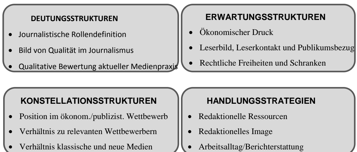
Abbildung 3: Schwerpunktthemen der Leitfaden-Interviews

Inhaltlich beschäftigten sich die Journalisten-Interviews mit den Zielen (Deutungsstrukturen – das Wollen), Zwängen und Programmen (Erwartungsstrukturen – das Sollen) sowie dem publizistischen Wettbewerb (Konstellationsstrukturen – das Können) medialer Akteure. Darüber hinaus wurde auch nach den spezifischen Akteurfiktionen und Handlungsstrategien der Gesprächspartner gefragt. Auf Basis der Grundlagenliteratur zur Handlungslogik der Massenmedien sowie zu den Trends am deutschen Medienmarkt wurden Schimanks abstrakte Begriffe in einem Kategoriensystem schrittweise zu praxisnahen, empirisch erfassbaren Bestandteilen des journalistischen Arbeitsalltags konkretisiert.