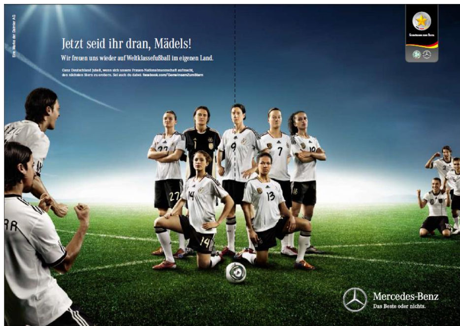
Abbildung 1: Männliche Unterstützung bei der Werbung für die Frauen-WM

Obwohl im Frauenfußball häufig betont wird, dass man als eigenständige Sportart wahrgenommen werden und nicht mit dem Männerfußball verglichen werden wolle (Hennies & Meuren, 2009, S. 79), wird doch beinahe genauso oft die große Popularität und Prominenz des letzteren genutzt, um auch dem Frauenfußball Bedeutung zu verleihen. Nachdem schon bei der Männer-WM in Deutschland 2006 „Die Welt zu Gast bei Freunden“ gewesen war, lautete daher das Motto der Frauen-WM-Bewerbung für 2011 „Wiedersehen bei Freunden“ (BMI, 2011, S. 35).