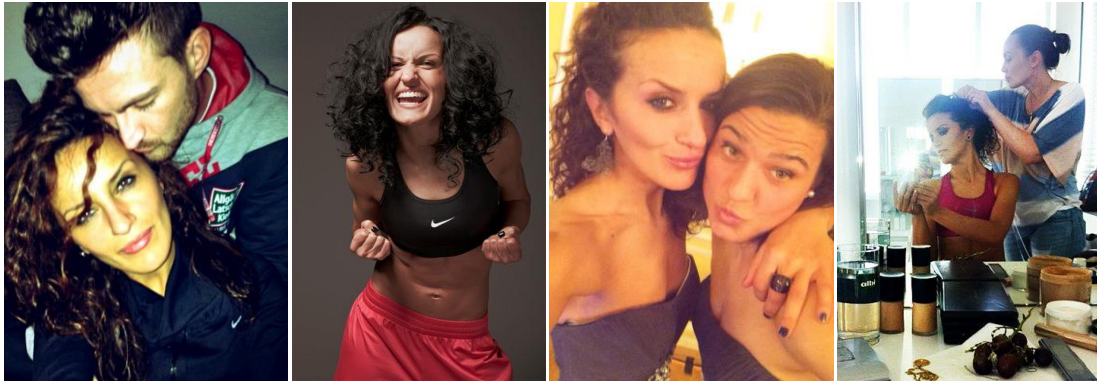
Abbildung 5: Bilder auf Fatmire Alushis Facebook-Fanpage (Quelle: https://de-de.facebook.com/Lira , 2012-2014, o. S.)

Ein weiteres Beispiel für ihre „Weiblichkeitsstrategie“ ist der Werbespot des Elektrofachmarkts Expert 2 , der im WM-Jahr 2011 ausgestrahlt wurde. Zunächst sieht man vier Nationalspielerinnen, darunter Alushi, in einer typischen Spielszene, bis plötzlich eine Zeitlupe einsetzt und die Sportlerinnen (noch im Fußballdress und auf dem Rasen) beginnen, sich hingebungsvoll zu schminken. Es ist von der „schönsten WM aller Zeiten“ die Rede.