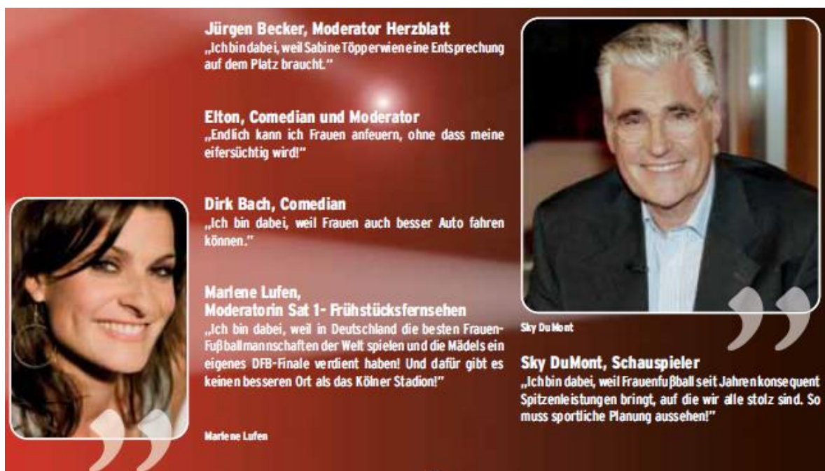
Abbildung 4: Prominente Unterstützer des eigenständigen DFB-Pokalfinales der Frauen

Die neue Eigenständigkeit des Finales wird von zahlreichen Prominenten unterschiedlichster Profession unterstützt, wie drei Seiten voller Zitate im ersten Kölner Programmheft 2010 belegen. Unter ihnen sind beispielsweise Model Monica Ivancan, Nationalspieler Lukas Podolski oder Schauspieler Sky DuMont.