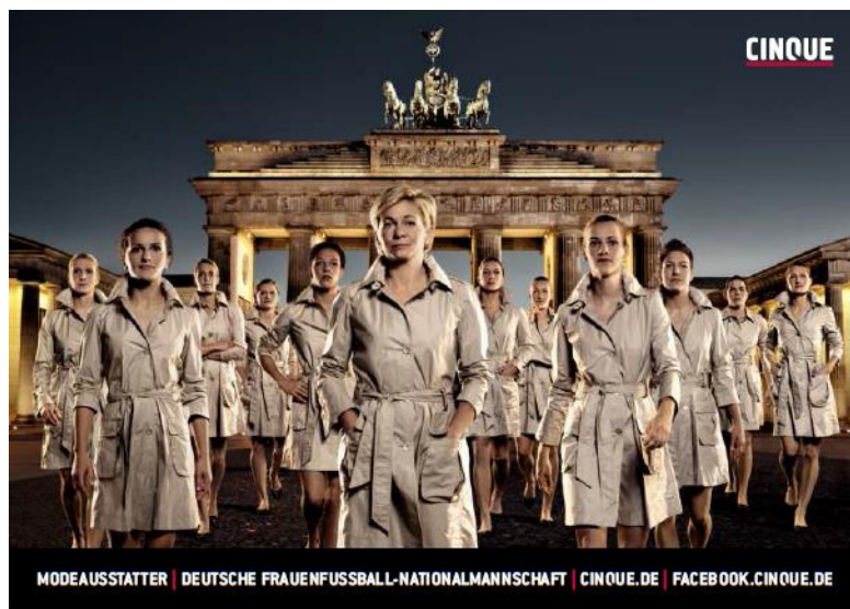
Abbildung 7: Werbung der Nationalmannschaft in Kleidung der Marke Cinque

Besonders freizügige Bilder von der A-Nationalmannschaft waren jedoch nicht zu finden.