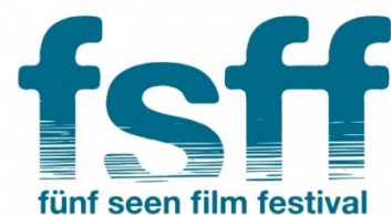
Abbildung 1 (links): Logo des Fünf Seen Filmfestivals 2007